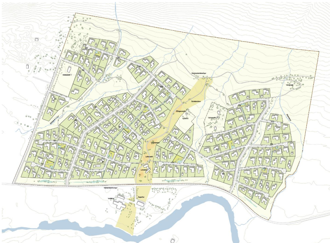
Mynd 2 - Tillaga A2F arkitekta - Afstöðumynd

A2F-arkitekta leggja til 200 lóðir í 23 klösum sem lagðir eru eftir hæðarlegu og landhalla á milli lækja.