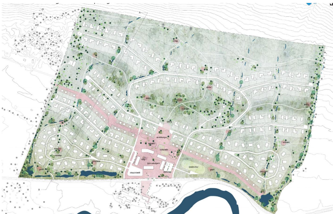
Mynd 3-Tillaga VA arkitekta - Afstöðumynd

A2F-arkitekta leggja til 200 lóðir í 23 klösum sem lagðir eru eftir hæðarlegu og landhalla á milli lækja.