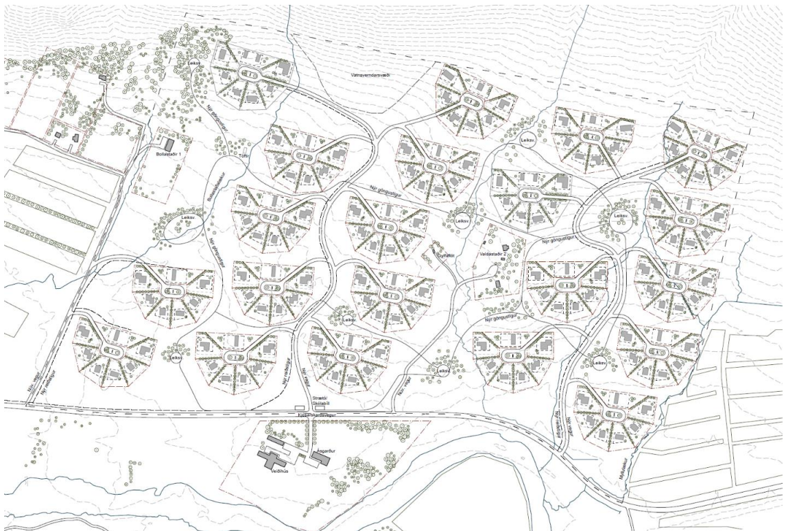
Mynd 1 - Tillaga Krads/Tripólí - Afstöðumynd

Í verkefnislýsingu var gert ráð fyrir 150-200 lóða byggð. Tillöguhöfundar hafa ólíka sýn á hve mikla uppbyggingu og þéttleika svæðið þolir.