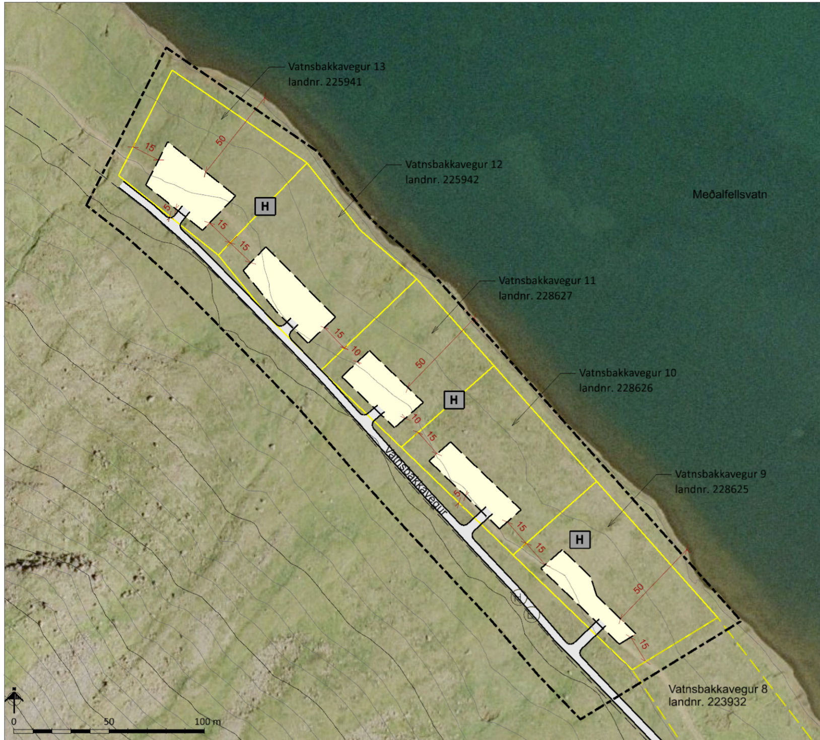
Deiliskipulagsuppdráttur í mkv. 1:2.000