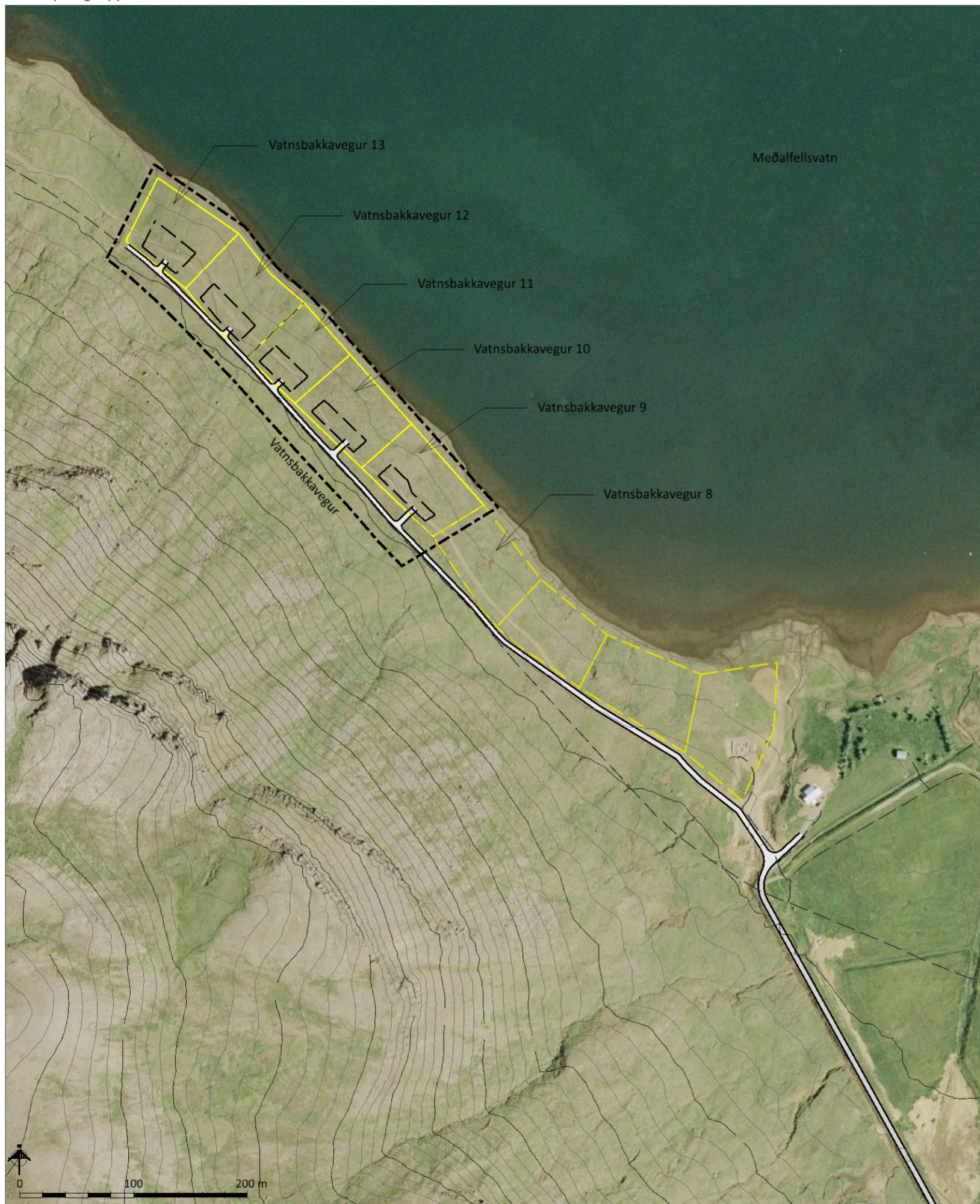
Skýringaruppdráttur í mkv. 1:4.000

Deiliskipulagstillagan var kynnt dags. _____ Deiliskipulagstillagan var auglýst frá _____ til _____ Deiliskipulag þetta sem auglýst hefur verið skv. 41. gr. skipulagslaga nr. 123/2010, með síðari breytingum var samþykkt af sveitarstjórn Kjósarhrepps þann _____ F.h. sveitarstjórnar Kjósarhrepps _____ Deiliskipulagstillagan öðlast gildi með auglýsingu í B-deild Stjórnartíðinda þann _____