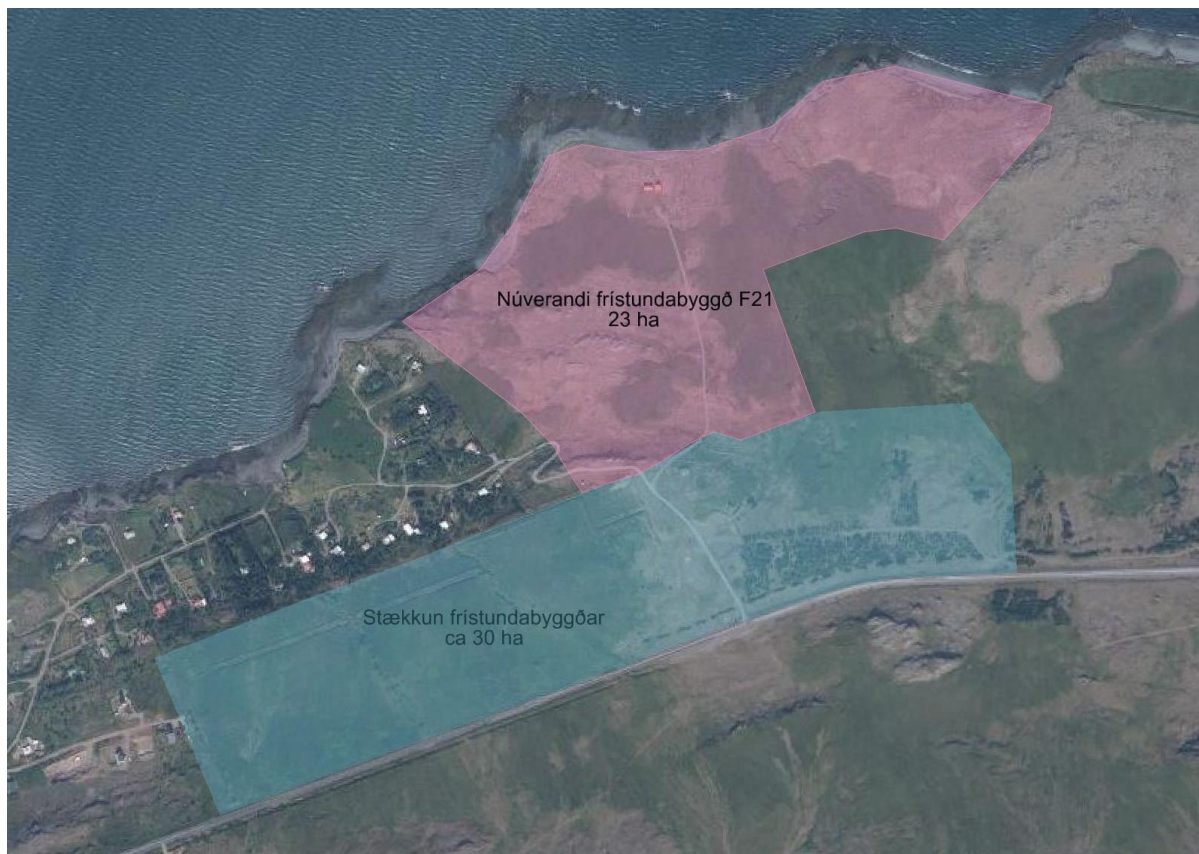
Mynd 2. Breytingin mun fjalla um svæðið sem merkt er með blárri skyggingu.

Innan breytingarsvæðisins eru skráðar minjar en um er að ræða heimildir um vörður eða landamerki. GK-353:049 heimild um landamerki „... ofar í mýri þessari [ en 048] er þúfa ein af jörð sem virðist hafa verið hlaðin á klett sem þar er” segir í landamerkjálýsingu Hvamms. Alveg syðst í mýrinni er smáhæð með smáþúfu sem gæti verið leifar af þessari vörðu en hún hefur greinilega verið orðin óljós þegar lýsingin var skrifuð 1890. GK-353:050 heimild um landamerki „Merkin eru nú bein lína frá grjótvörðunni við sjóinn, yfir þúfunu í mýrinni og alla leið uppá hálsbrún, á línu þessari eru hlaðnar 4ar vörður, sem eru grjótvarðan við sjóinn, á þúfunni í mýrinni, norður á hálsbrúninni ...” segir í landamerkjálýsingu Hvamms. Ekki er nú hægt að sjá vörðu á þessum stað, skammt norðan þjóðvegur. 1