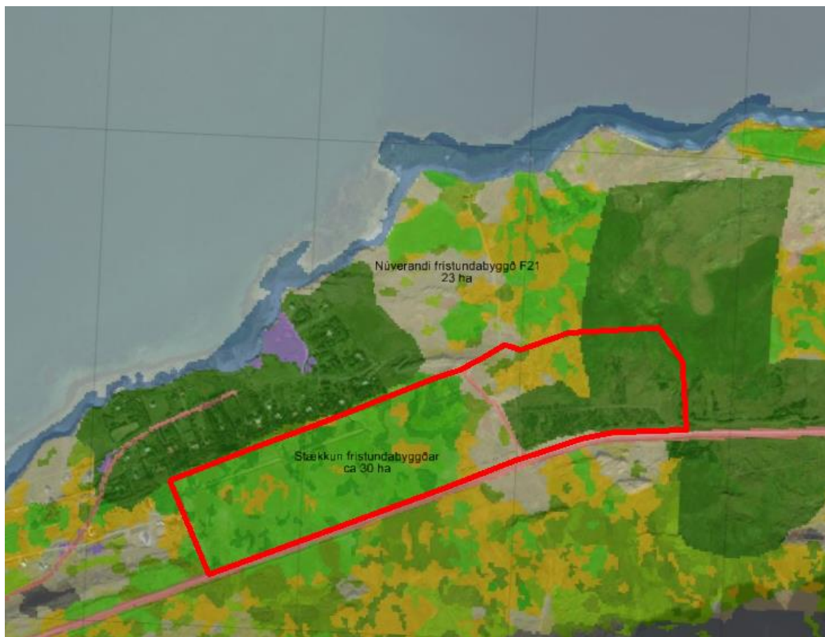
Mynd 1. Vistgerðarkort Náttúrufræðistofnunar Íslands

Skipulagssvæðið er í landi Hvamms og Hvammsvíkur í Kjósarhreppi. Breytingarsvæðið er í dag að mestu skilgreint sem landbúnaðarsvæði og efnistökusvæði í Aðalskipulagi Kjósarhrepps 2017-2029 en sem hverfisverndarsvæði og landnemaspildur í gilandi deiliskipulagi Hvamms og Hvammsvíkur. Helstu vistgerðir samkvæmt vistgerðarkorti Náttúrufræðistofnunar Íslands eru að fyrir sunnan frístundasvæði F20a, Hvammur, einkennist landið af graslendi og votlendisblettum inn á milli. Um er að ræða grasengjavist, stinnastaravist og starungsmýravist. Austan megin við aðkomuveg að Hvammi er það aðallega skógrækt en einnig moslendi og votlendissvæði sem eru einkennandi.