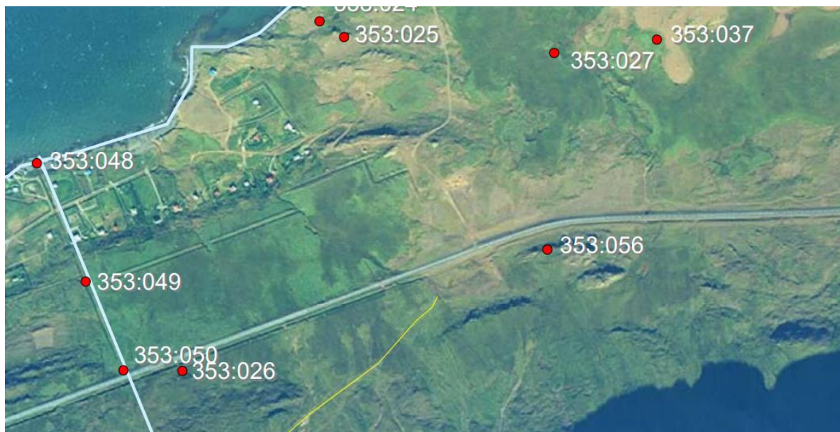
Mynd 3. Skráðar minjar innan breytingarsvæðisins.