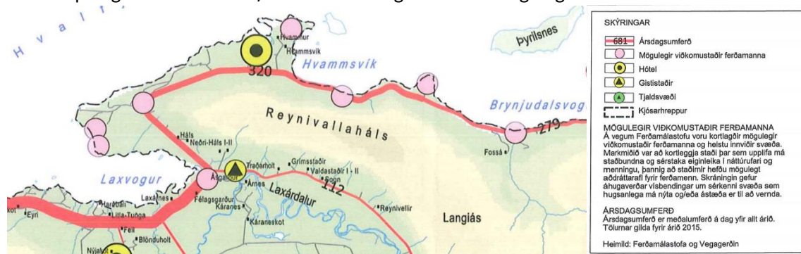
Mynd 2. Skýringaruppráttur úr aðalskipulagi Kjósarhrepps 2017-2029. Ferðaþjónusta og áhugaverðir staðir.

Á jörðinni Hvammsvík er í aðalskipulagi Kjósarhrepps 2017-2029 skilgreindur reitur fyrir verslun og þjónustu, VP3 Hvammsvík. Um hann segir í aðalskipulaginu: Gert er ráð fyrir byggingu hótels, með gistingu fyrir allt að 50 gesti ásamt veitingastað, ylströnd, aðstöðu til sjósunds og gerð bátaskýlis. Einnig þjónustu við golfvöll í Hvammsvík. Stærð svæðis er allt að 5 ha. Reiturinn er sýndur vestan við Hvamm í aðalskipulaginu en gera þarf óverulega breytingu á aðalskipulaginu samhliða deiliskipulagsbreytingu þessari og færa VP3 austur fyrir Hvamm þar sem uppbyggingin er fyrirhuguð. Í aðalskipulaginu er Hvammur/Hvammsvík skilgreind sem mögulegir viðkomustaðir ferðamanna.