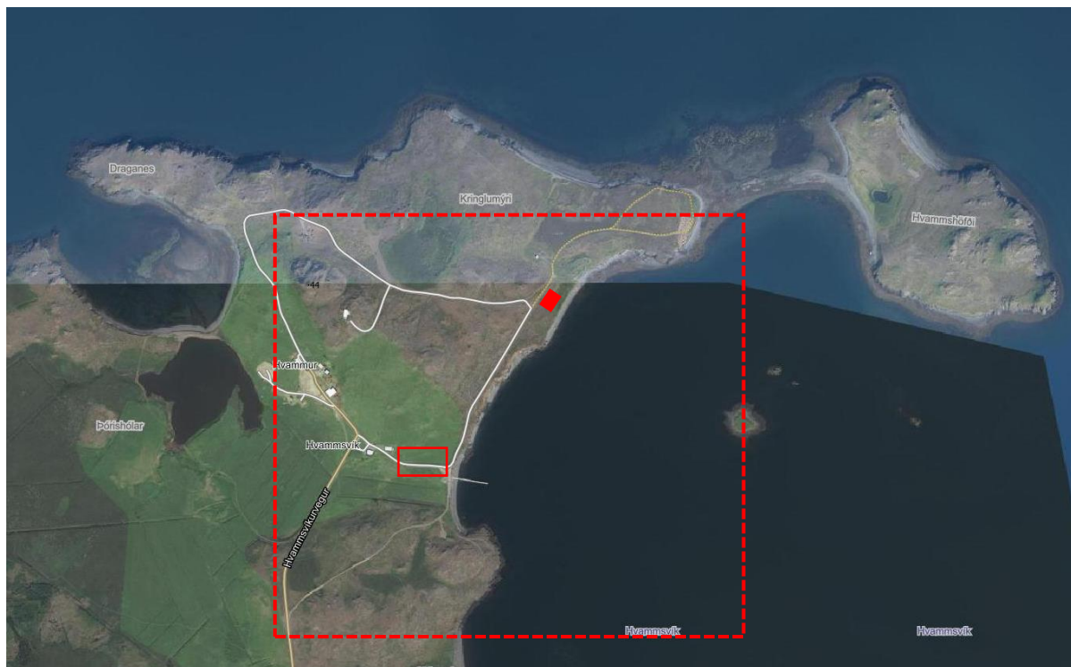
Mynd 4. Yfirlitsmynd af svæðinu.

Á gildandi upprætti eru sýndir byggingarreitir fyrir 5 orlofshús á vegum staðarhaldara á hverfisvernduðu svæði vegna þjóð- og stríðsminja. Verða þessir byggingarreitir, staðsetning þeirra og skipulag á þessu svæði endurskoðað við breytingu þessa, en bílastæði eru áformuð á þessum slóðum.